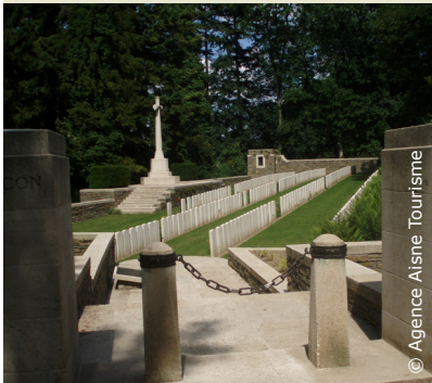
Cimetière britannique de Trefcon