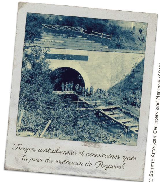
Troupes australiennes et américaines après la prise du souterrain de Riqueval.

En 1919, après de longues tergiversations, la 4 e Division choisit les hauteurs du lieu-dit « Les Chaudries » au nord-ouest du village de Bellenglise pour y installer un monument. Ce lieu donne sur le canal de Saint-Quentin. Il est le point culminant des efforts de la 4 e Division australienne et lieu de leur dernière bataille pendant la guerre.