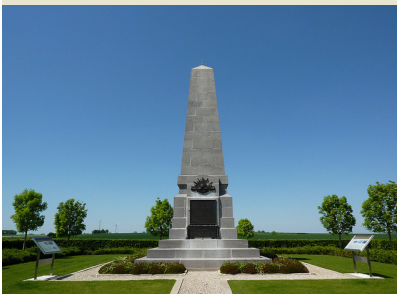
Le mémorial australien de Bellenglise